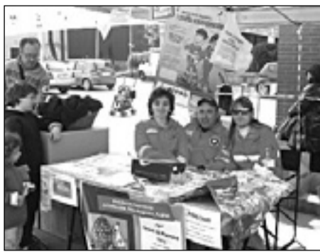
L'Assistenza volontaria ha venduto uova pasquali

FELINO In centro anche il mercato Domenica ecologica promossa dai cittadini Regalati ai bambini matite riciclate