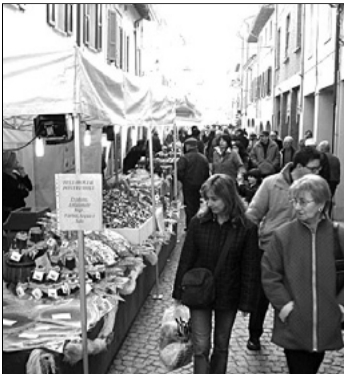
La vie del centro affollate di visitatori in cerca di prelibatezze

in costume dell'associazione Corte dei Rossi hanno divertito la folla che si è accalata in piazza della Chiesa, con l'allegria rie-