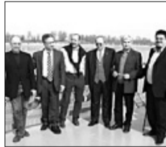
Il gruppo del "barcaioli" Ds sul Po

Al viaggio hanno anche partecipato il presidente della Provin-