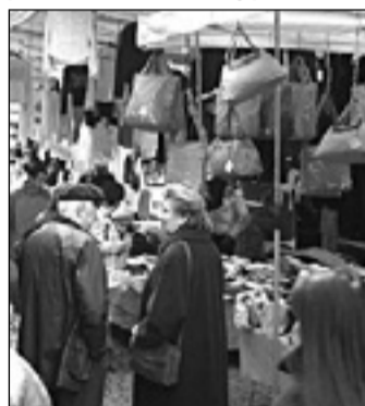
Le bancarelle della Versilia prese d'assalto

Il mercatino dei prodotti tipici ha catturato la curiosità della gente per le prelibatezze prove-